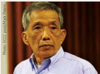
កាំង ហ្គេកអិវ ហៅ ឌុច