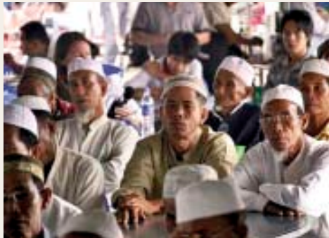
ប្រជាជនកម្ពុជានៅទូទាំងប្រទេសស្វែងយល់អំពីដំណើរការរបស់ អ.វ.ត.ក តាមរយៈកម្មវិធីផ្សព្វផ្សាយរបស់តុលាការនេះ។ ប្រជាជនជាង ៣១.៤០០នាក់ បានមកចូលរួមស្តាប់នៅភ្នាក់ងារក្នុងសំណុំរឿង ០០១ ប្រចាំឆ្នាំនិង កាំង ហ្គេកអិវ ហៅ ឌុច ហើយជាង៣ម៉ឺន២ពាន់នាក់ផ្សេងទៀតបានចូលរួមក្នុងកម្មវិធីទស្សនកិច្ចសិក្សារបស់ អ.វ.ត.ក ក្នុងឆ្នាំ២០១០។ សៀវភៅសាលក្រម ឌុច ជិត ៣ម៉ឺនក្បាល ត្រូវបានចែកចាយដោយឥតគិតថ្លៃដល់សាធារណជន ទូទាំងប្រទេស។