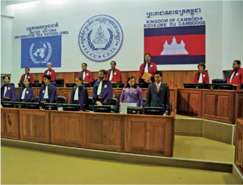
ចៅក្រមនៃអង្គជំនុំជម្រះសាលាដំបូងនៅក្នុងសវនាការថ្ងៃទី ២៧ ខែវិច្ឆិកា ឆ្នាំ២០០៩ ដែលជាសវនាការចុងក្រោយបង្អស់នៃសំណុំរឿង ០០១