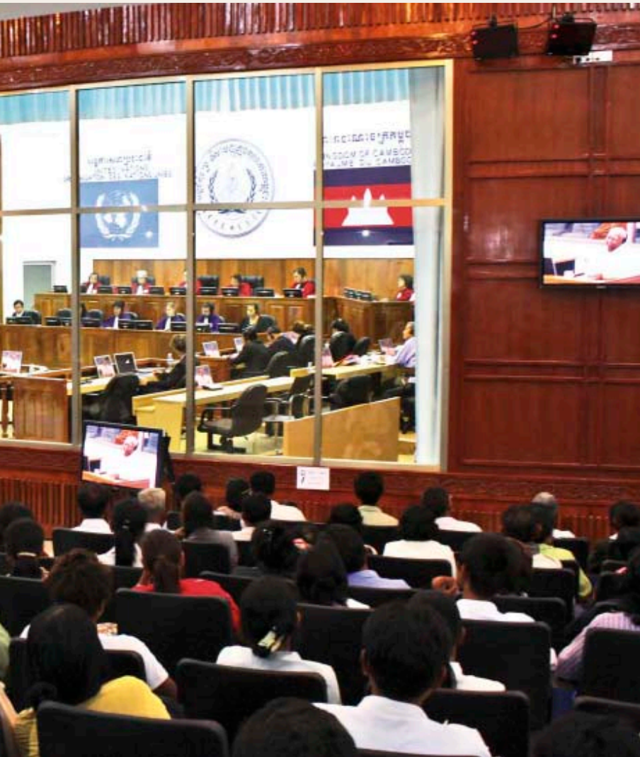
ជំប៉ុតក្នុងចំណោមសាលសវនាការរបស់តុលាការអន្តរជាតិទាំងអស់នៅលើពិភពលោកដែលគាំទ្រដោយអង្គការសហប្រជាជាតិ