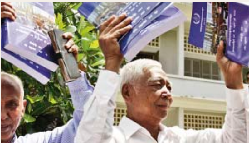
រូបថត: មជ្ឈមណ្ឌលដោះស្រាយកម្ពុជា