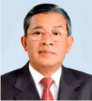
ដោយសម្តេចអគ្គមហាសេនាបតីតេជោ ហ៊ុន សែន នាយករដ្ឋមន្ត្រី នៃព្រះរាជាណាចក្រកម្ពុជា