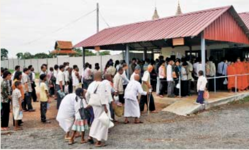
ប្រជាជនតម្រង់ជួរនៅមុខច្រកចូលនៃអង្គជំនុំជម្រះវិសាមញ្ញក្នុងតុលាការកម្ពុជា ដើម្បីចូលរួមស្តាប់សវនាការសាធារណៈ