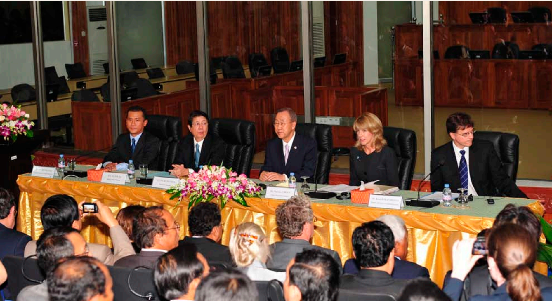
ដំណើរទស្សនកិច្ចជាប្រវត្តិសាស្ត្រនៅ អ.វ.ត.ក ដោយ ឯកឧត្តម បាន គីមុន អគ្គលេខាធិការអង្គការសហប្រជាជាតិ នៅថ្ងៃទី២៧ ខែតុលា ឆ្នាំ២០១០ ។ ក្នុងរូបថតនេះពីឆ្វេងទៅស្តាំ ឯកឧត្តម ឧបនាយករដ្ឋមន្ត្រី សុខ អាន ឯកឧត្តម បាន គីមុន លោកស្រី ប៉ាទ្រីសា អូប្រាណ អគ្គលេខាធិការអង្គការសហប្រជាជាតិទទួលបន្ទុកផ្នែកច្បាប់ និងលោក ឃុត វ៉ូស៊ីនហក អនុប្រធានការិយាល័យរដ្ឋបាលនៃ អ.វ.ត.ក ។