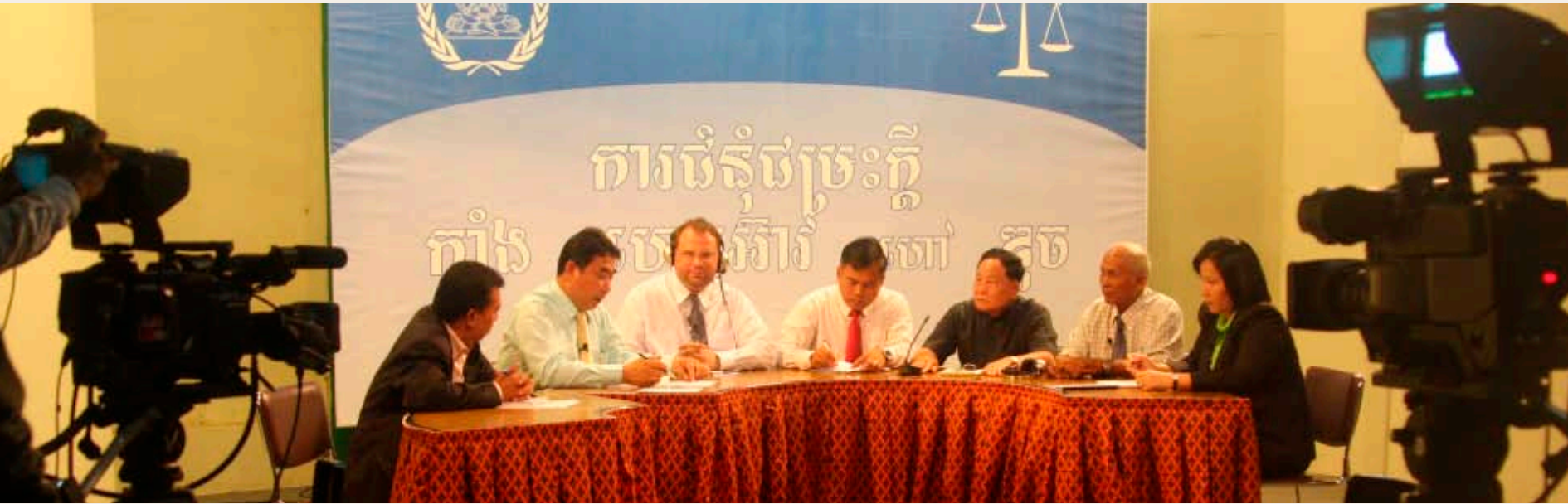
អ.វ.ត.ក នៅលើកញ្ចក់ទូរទស្សន៍: មន្ត្រីគុណការនិងផ្នែកពាក់ព័ន្ធនៅក្នុងសំណុំរឿង ០០១ នៅក្នុងកិច្ចពិភាក្សាគុណការនៅក្នុងស្ទូឌីយោ ទូរទស្សន៍ជាតិកម្ពុជា មុនពេលប្រកាសសាលក្រមក្នុងសំណុំរឿង ០០១