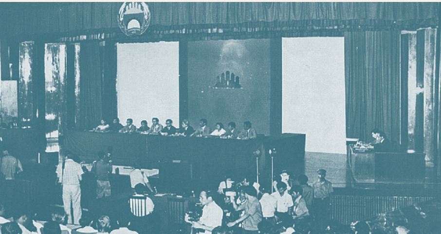
Sapordamean Khmer (SPK)