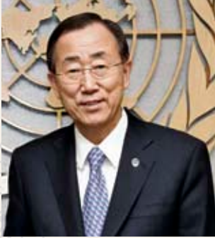
របស់លោក បាន គីមុន អគ្គលេខាធិការអង្គការសហប្រជាជាតិ ខែ ធ្នូ ឆ្នាំ ២០១០

អង្គជំនុំជម្រះវិសាមញ្ញក្នុងតុលាការកម្ពុជា ត្រូវបានបង្កើតឡើងដើម្បីស្វែងរកយុត្តិធម៌ជូនប្រជាជនកម្ពុជាដែលបានឆ្លងកាត់ឧក្រិដ្ឋកម្មគួរឲ្យភ័យខ្លាច ដែលបានកើតឡើងនៅកម្ពុជាក្នុងទសវត្សរ៍ឆ្នាំ១៩៧០ ។ ចាប់តាំងពីពេលចាប់ផ្តើមដំណើរការនៅខែមករា ឆ្នាំ២០០៦ អង្គជំនុំជម្រះវិសាមញ្ញបានវិវឌ្ឍទៅមុខគួរឲ្យកត់សម្គាល់។ សាលក្រមក្នុងសំណុំរឿង ០០១ លើករណីប្រធានមន្ទីរ ស-២១ សបញ្ជាក់អំពីសមត្ថភាពរបស់ អ.វ.ត.ក ក្នុងការជំនុំជម្រះលើសំណុំរឿងស្មុគស្មាញស្របតាមបទដ្ឋានអន្តរជាតិ ហើយដឹកចោទប្រកាន់និងបញ្ជូនរឿងទៅជំនុំជម្រះលើអតីតមេដឹកនាំ ៤ រូប នៃរបបខ្មែរក្រហមក្នុងសំណុំរឿង ០០២ បញ្ជាក់ជាថ្មីម្តងទៀតថា គ្មាននរណាអាចគេចផុតពីសំណាញ់ច្បាប់បានឡើយ ។