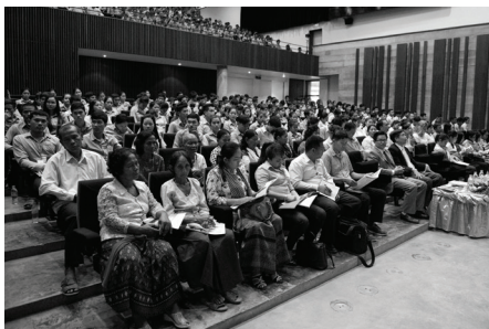
ដើមបណ្តឹងរដ្ឋប្បវេណីចូលរួមទស្សនាពិពណ៌នាលើស្តីពីជនរងគ្រោះនៃរបបខ្មែរក្រហម នៅសៀមរាប

អាក់អន់ចិត្ត មិនមានការគាំទ្រ និងមានអារម្មណ៍ថា មិនបានទទួលនូវយុត្តិធម៌។