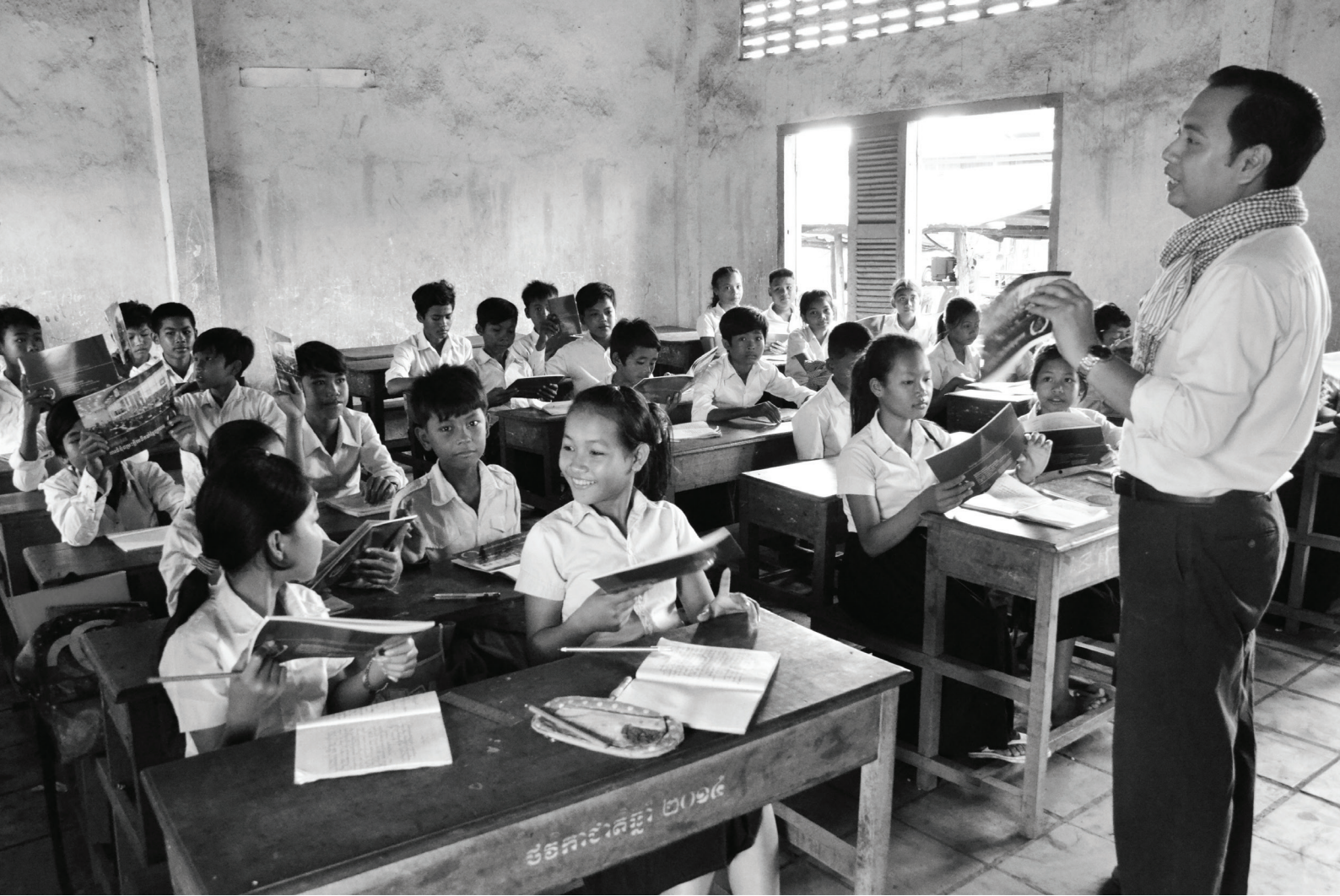
សិស្សានុសិស្សនៅសាលាអន្លង់វែង ស្តាប់ការពន្យល់រៀបរាប់ពី ផ្នែកកិច្ចការសាធារណៈ អំពីការវិនិច្ឆ័យនៅ អ.វ.ត.ក