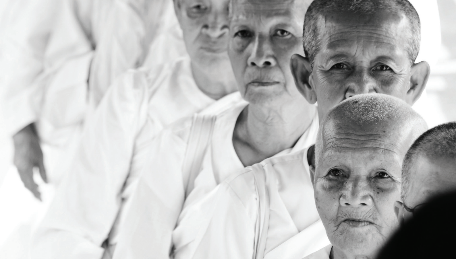
ជូនដីតម្រង់ជួរនៅ អ.វ.ត.ក ដើម្បីចូលរួមស្តាប់សវនាការ ក្នុងសំណុំរឿង ០០២/០១

ហេតុដូច្នេះវាហាក់ដូចជា ថា ដំណាក់កាលនៅ សេសសល់របស់តុលាការ ទទួលស្គាល់ដោយខ្លួនឯង ថា ត្រូវចូលរួមចំណែកដល់ ដំណើរការព្យាបាលរបួស ស្នាមរបស់ជនរងគ្រោះ និង ជំរុញជាទ្រង់ទ្រាយធំ ដល់ ការផ្សះផ្សាជាតិ។