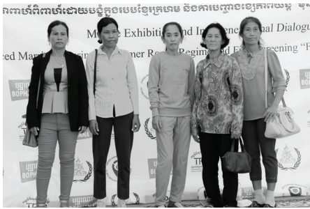
ដើមបណ្តឹងរដ្ឋប្បវេណីចូលរួមទស្សនាពិព័រណ៍ចល័ត ស្តីពីជនរងគ្រោះនៃរបបខ្មែរក្រហម នៅសៀមរាប

មួយនៅប្រទេសសៀរ៉ាឡេអូន ដែលរក្សាទុកនូវឯកសារចម្លងនៃកំណត់ត្រាសាធារណៈរបស់តុលាការពិសេស។ ការរក្សាទុកទាំងនេះ នឹងរួមបញ្ចូលជាមួយកំណត់ត្រា របស់គណៈកម្មការជ្រុះជួញនិងស្វែងរកការពិត និងគណៈកម្មការជាតិសម្រាប់ការរំសាយសញ្ជាតិ ការរំសាយកងទ័ព និងការធ្វើសមាហរណកម្មឡើងវិញ ដើម្បីបង្កើតជាមជ្ឈមណ្ឌលស្រាវជ្រាវរួមមួយ សម្រាប់យុត្តិធម៌អន្តរកាល បន្ទាប់ពីមានសង្គ្រាមស៊ីវិលនៅសៀរ៉ាឡេអូន។ បច្ចុប្បន្ននេះ ប្រទេសសៀរ៉ាឡេអូនមិនមានស្ថាប័ន ដែលមានសម្ភារៈឬប្រព័ន្ធដែលអាចរក្សាទុកដោយត្រឹមត្រូវ នូវបណ្ណសារជាអចិន្ត្រៃយ៍។ សារមន្ទីរសន្តិភាព បានផ្តល់ដំណោះស្រាយបណ្តោះអាសន្ន ដែលអាចទទួលអ្នកប្រើប្រាស់ក្នុងចំនួនតិចប៉ុន្តែទីតាំងដែលប្រើសម្រាប់តែបណ្ណសារ នឹងធ្វើឱ្យកាន់តែប្រសើរឡើងដល់ការចូលមើល និងការគ្រប់គ្រង ព្រមទាំងការអភិរក្សកំណត់ត្រា។ តុលាការ SCSL រៀបចំកម្មវិធីបណ្តុះបណ្តាលលើបណ្ណសារមួយចំនួន សម្រាប់បុគ្គលិកបណ្ណសារជាតិ និងស្ថាប័នដទៃទៀត ក្នុងការគ្រប់គ្រងបណ្ណសារ។ មានតម្រូវការធនធានបន្ថែម សម្រាប់ការបង្កើតទីតាំងដែលកសាងឡើងក្នុងគោលបំណងជាក់ស្តែង ដែលនឹងអភិរក្សដល់ឯកសារសាធារណៈរបស់បណ្ណសារតុលាការពិសេស សម្រាប់មនុស្សជំនាន់ក្រោយ។