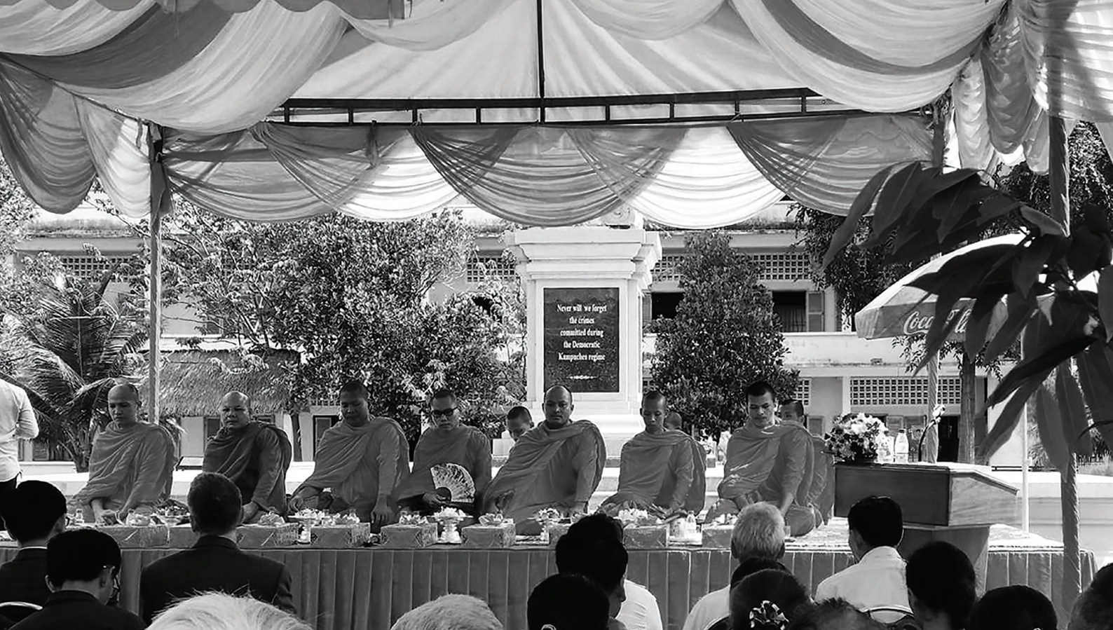
ព្រះសង្ឃសូត្រមន្តប្រោសព្រៃដល់អ្នករស់រានមានជីវិតពីរបប ខ្មែរក្រហម និង ដើមបណ្តឹងរដ្ឋប្បវេណីចូលរួមទិវាចងចាំ ថ្ងៃទី២០ ខែឧសភា ដែលប្រារព្ធធ្វើនៅសារមន្ទីរប្រល័យ ពូជសាសន៍ទួលស្វែង

អ្វីដែលមិនស្ថិតនៅក្នុងសំណើណាមួយ ប៉ុន្តែមានតម្លៃគួរពិចារណា នៅក្នុងទស្សនៈរបស់យើងគឺការបង្កើតសេវាគាំពារជនរងគ្រោះនៅក្នុង ប្រព័ន្ធច្បាប់ព្រហ្មទណ្ឌជាតិ។ សេវាទាំងនេះរួមមាន សេវាជាពិសេស ទោះបីជាមិនផ្តល់មុខ សម្រាប់ជនរងគ្រោះនៃបទល្មើសពាក់ព័ន្ធផ្លូវភេទ និង ជនជាតិភាគតិច ក្នុងនោះរួមមានការគាំទ្រច្បាប់ ហិរញ្ញវត្ថុ និង ចិត្តសាស្ត្រ។