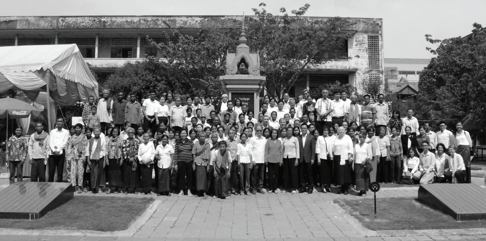
អ្នករស់រានមានជីវិតពីរបបខ្មែរក្រហម និង ដើមបណ្តឹងរដ្ឋប្បវេណីចូលរួមទិវាចងចាំថ្ងៃទី២០ ខែឧសភា នៅសារមន្ទីរប្រល័យពូជសាសន៍ទួលស្លែង

សហចៅក្រមរបាយការណ៍ ទទួលបានសារណាចំនួន ២០ ពីអ្នកពាក់ព័ន្ធនានានា។ សហចៅក្រមរបាយការណ៍បានជំរុញនិងធ្វើការយ៉ាងសកម្ម ជាមួយអ្នកពាក់ព័ន្ធនានា ដែលបានទំនាក់ទំនងមកពួកគាត់។