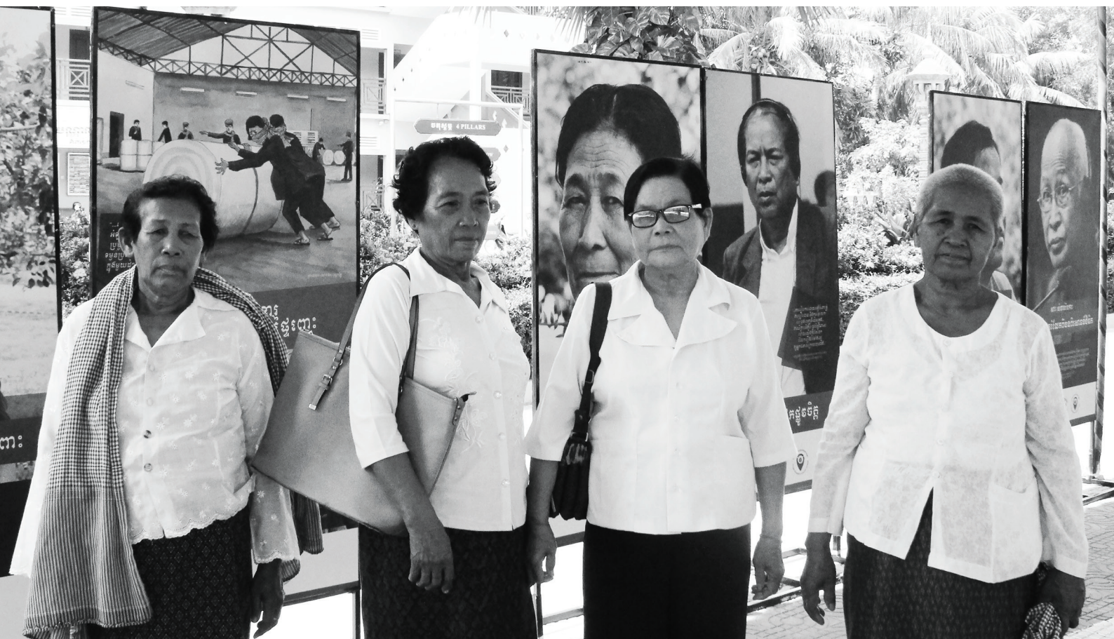
ដើមបណ្តឹងរដ្ឋប្បវេណីចូលរួមសុនាមិពិរណ៍ចល័ត ស្តីពី ជនរងគ្រោះនៃរបបខ្មែរក្រហម នៅសៀមរាប

នេះគឺជាការពិតមួយដែលត្រូវធ្វើការពិចារណា នៅពេលគ្រោង បង្កើតតុលាការព្រហ្មទណ្ឌដែលមាន ចរិតលក្ខណៈអន្តរជាតិបន្តិយកម្ម ដទៃទៀត។