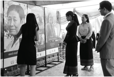
អភិបាលខេត្តកោះកុងស្តាប់ការពន្យល់រៀបរាប់ អំពីការរៀបការ ដោយបង្ខំក្នុងរបបខ្មែរក្រហម