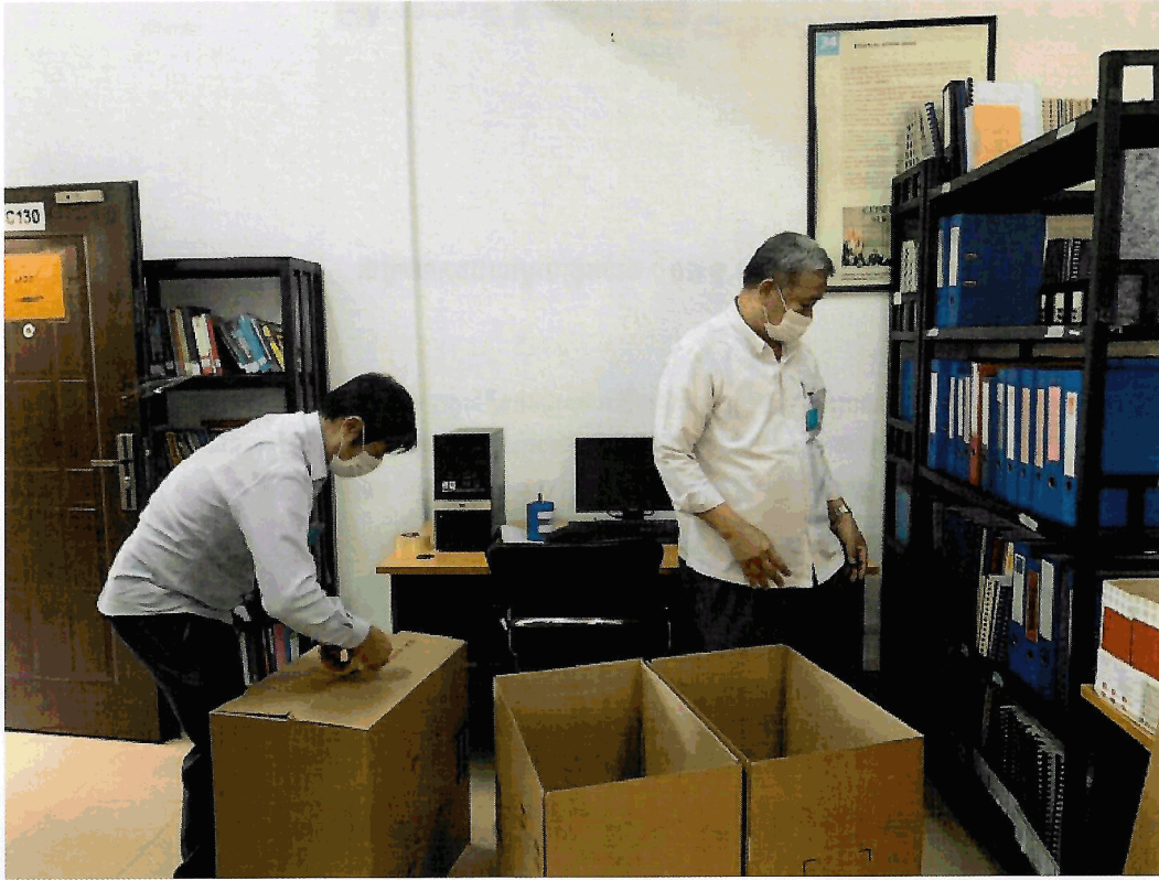
សូមជម្រាបជូនថា ចាប់តាំងពីឆ្នាំ១៩៩៥មក មជ្ឈមណ្ឌលឯកសារកម្ពុជា បានជួយដល់អ្នករស់រានមានជីវិតពីរបបខ្មែរក្រហមជាច្រើន ក្នុងការដាក់ពាក្យបណ្តឹងនិងប្រមូល ចងក្រងសាច់រឿងនានា ដែលគាំពារដល់ការចងចាំជាសាធារណៈ ការអប់រំពិភពលោក និងការងាររបស់អង្គជំនុំជម្រះវិសាមញ្ញក្នុងតុលាការកម្ពុជា (ឬសាលាក្តីខ្មែរ ក្រហម)។