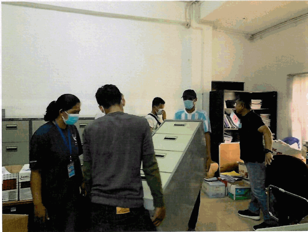
បើតាមមជ្ឈមណ្ឌលឯកសារកម្ពុជាបានឱ្យដឹងថា ការបរិច្ចាគឯកសារនេះ គឺជាសក្ខីភាពនៃដំហានឆ្ពោះទៅមុខបន្ទាប់ នៅក្នុងកិច្ចខិតខំប្រឹងប្រែងបង្កើនអត្ថប្រយោជន៍របស់ដើម បណ្តឹងរដ្ឋប្បវេណី, ជនរងគ្រោះ និងសមាជិកគ្រួសារដែលរស់រានមានជីវិតពីរបបខ្មែរក្រហម ដើម្បីធានាថា យុត្តិធម៌មិនមែនបញ្ចប់ទៅនៅពេលដែលតុលាការខ្មែរក្រហមបិទ បញ្ចប់ប្រតិបត្តិការរបស់ខ្លួនទេ។