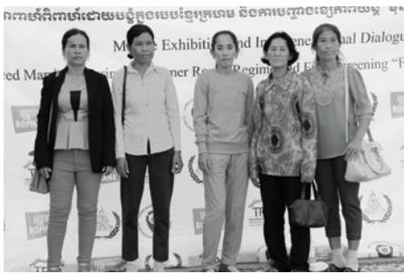
ដើមបណ្តឹងរដ្ឋប្បវេណីចូលរួមទស្សនាពិព័រណ៍ចល័ត ស្តីពី ជនរងគ្រោះនៃរបបខ្មែរក្រហម នៅសៀមរាប

មួយនៅប្រទេសសៀងខ្មែរ ដែលរក្សាទុកនូវឯកសារចម្លងនៃ កំណត់ត្រាសាធារណៈរបស់តុលាការពិសេស។ ការរក្សាទុក ទាំងនេះ នឹងរួមបញ្ចូលជាមួយកំណត់ត្រា របស់គណៈកម្មការ ជម្រះជនរងគ្រោះ និងស្វែងរកការពិត និងគណៈកម្មការជាតិសម្រាប់ការ រំសាយសញ្ញាវុធ ការរំសាយកងទ័ព និងការធ្វើសមាហរណ កម្មឡើងវិញ ដើម្បីបង្កើតជាមជ្ឈមណ្ឌលស្រាវជ្រាវរួមមួយ សម្រាប់យុត្តិធម៌អន្តរកាល បន្ទាប់ពីមានសង្គ្រាមស៊ីវិលនៅ សៀងខ្មែរ។ បច្ចុប្បន្ននេះ ប្រទេសសៀងខ្មែរមិនមានស្ថា ប័ន ដែលមានសម្ភារៈប្រព័ន្ធដែលអាចរក្សាទុកដោយត្រឹមត្រូវ នូវបណ្ណសារជាអចិន្ត្រៃយ៍។ សារមន្ទីរសន្តិភាព បានផ្តល់ ដំណោះស្រាយបណ្តោះអាសន្ន ដែលអាចទទួលអ្នកប្រើប្រាស់ ក្នុងចំនួនតិច ប៉ុន្តែទីតាំងដែលប្រើសម្រាប់តែបណ្ណសារ នឹងធ្វើ ឱ្យកាន់តែប្រសើរឡើងដល់ការចូលមើល និងការគ្រប់គ្រង ព្រមទាំងការអភិរក្សកំណត់ត្រា។ តុលាការ SCSL រៀបចំកម្មវិធី បណ្តុះបណ្តាលលើបណ្ណសារមួយចំនួន សម្រាប់បុគ្គលិកបណ្ណ សារជាតិ និងស្ថាប័នដទៃទៀត ក្នុងការគ្រប់គ្រងបណ្ណសារ។ មានតម្រូវការធនធានបន្ថែម សម្រាប់ការបង្កើតទីតាំងដែល កសាងឡើងក្នុងគោលបំណងជាក់ស្តែង ដែលនឹងអភិរក្សដល់ ឯកសារសាធារណៈ របស់បណ្ណសារតុលាការពិសេស សម្រាប់ មនុស្សជំនាន់ក្រោយ។