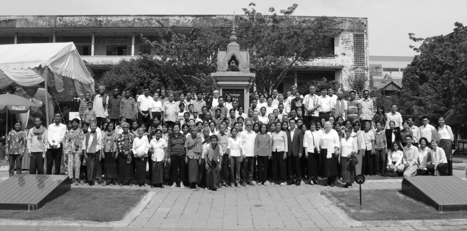
អ្នករស់រានមានជីវិតពីរបបខ្មែរក្រហម និង ដើមបណ្តឹងរដ្ឋប្បវេណីចូលរួមទិវាចងចាំថ្ងៃទី២០ ខែឧសភា នៅសារមន្ទីរប្រល័យពូជសាសន៍ទួលស្លែង

សហចៅក្រមរបាយការណ៍ ទទួលបានសារណាចំនួន ២០ ពីអ្នកពាក់ព័ន្ធនានានា។ សហចៅក្រមរបាយការណ៍បានជំរុញនិងធ្វើការយ៉ាងសកម្ម ជាមួយអ្នកពាក់ព័ន្ធនានា ដែលបានទំនាក់ទំនងមកពួកគាត់។