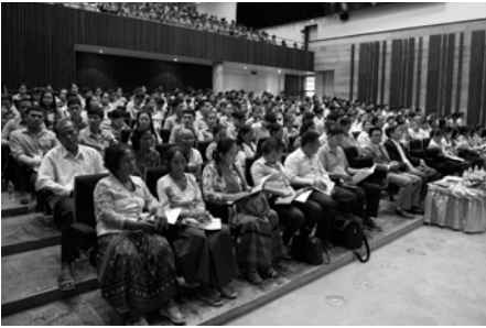
ដើមបណ្តឹងរដ្ឋប្បវេណីចូលរួមទស្សនាពិធីរណ៍ចល័ត ស្តីពីជនរងគ្រោះនៃរបបខ្មែរក្រហម នៅសៀមរាប

អាក់អន់ចិត្ត មិនមានការគាំទ្រ និងមានអារម្មណ៍ថា មិនបានទទួលនូវយុត្តិធម៌។