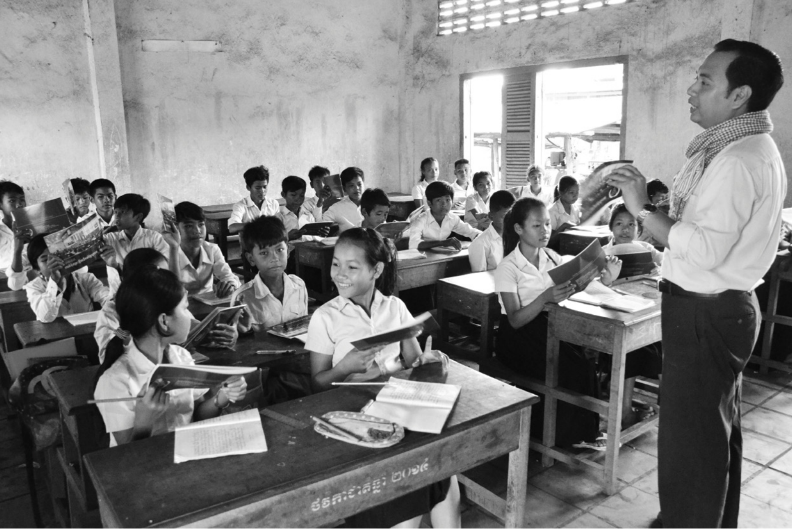
សិស្សានុសិស្សនៅសាលាអន្លង់វែង ស្តាប់ការពន្យល់រៀបរាប់ពី ផ្នែកកិច្ចការសាធារណៈ អំពីការវិនិច្ឆ័យនៅ អ.វ.ត.ក

របាយការណ៍ប្រឹក្សានិង សកម្មភាពនានានាំទៅដល់ការ ធ្វើរបាយការណ៍នេះត្រូវចាត់ជា ចំណុចចាប់ផ្តើមនៃដំណើរការដី វែងឆ្ងាយដែលទើបចាប់ផ្តើម។