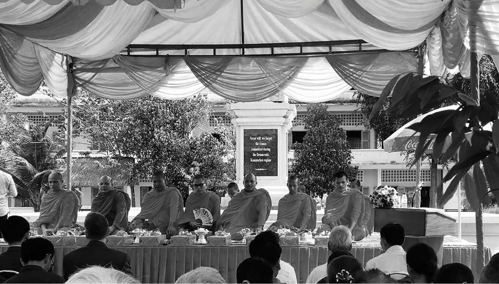
ព្រះសង្ឃសូត្រមន្តប្រោសព្រះដល់អ្នករស់រានមានជីវិតពីរបប ខ្មែរក្រហម និង ដើមបណ្តឹងរដ្ឋប្បវេណីចូលរួមទិវាចងចាំ ថ្ងៃទី២០ ខែឧសភា ដែលប្រារព្ធធ្វើនៅសារមន្ទីរប្រល័យ ពូជសាសន៍ទួលស្វែង

អ្វីដែលមិនស្ថិតនៅក្នុងសំណើណាមួយ ប៉ុន្តែមានតម្លៃគួរពិចារណា នៅក្នុងទស្សនៈរបស់យើងគឺការបង្កើតសេវាគាំពារជនរងគ្រោះនៅក្នុង ប្រព័ន្ធច្បាប់ព្រហ្មទណ្ឌជាតិ។ សេវាទាំងនេះរួមមាន សេវាជាពិសេស ទោះបីជាមិនផ្តាច់មុខ សម្រាប់ជនរងគ្រោះនៃបទល្មើសពាក់ព័ន្ធផ្លូវភេទ និង ជនជាតិភាគតិច ក្នុងនោះរួមមានការគាំទ្រច្បាប់ ហិរញ្ញវត្ថុ និង ចិត្តសាស្ត្រ។