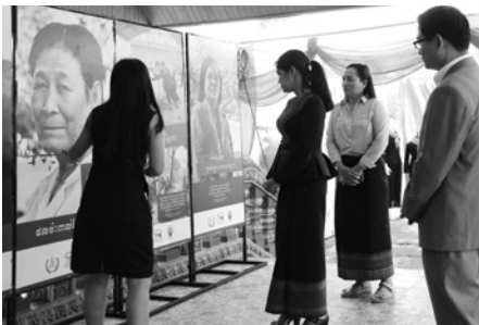
អភិបាលខេត្តកោះកុងស្តាប់ការពន្យល់រៀបរាប់ អំពីការរៀបការដោយបង្ខំក្នុងរបបខ្មែរក្រហម