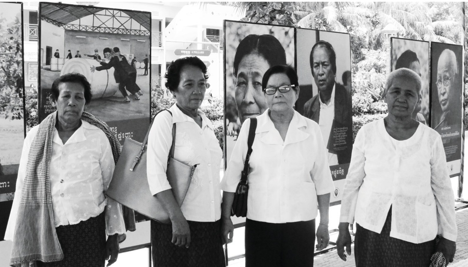
ដើមបណ្តឹងរដ្ឋប្បវេណីចូលរួមទស្សនាពិព័រណ៍ចល័ត ស្តីពី ជនរងគ្រោះនៃរបបខ្មែរក្រហម នៅសៀមរាប

នេះគឺជាការពិតមួយដែលត្រូវធ្វើការពិចារណា នៅពេលគ្រោង បង្កើតតុលាការព្រហ្មទណ្ឌដែលមាន ចរិតលក្ខណៈអន្តរជាតិបន្តិយកម្ម ដទៃទៀត។